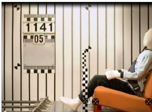
Рис 2а. Время 0 мсек. Манекен в исходном состоянии

На рисунке видно как нижняя часть ремня во время удара глубоко входит в живот манекена во время подныривания.