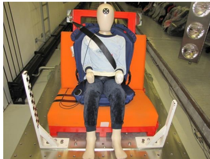
Рис 3. Подготовка к тесту.