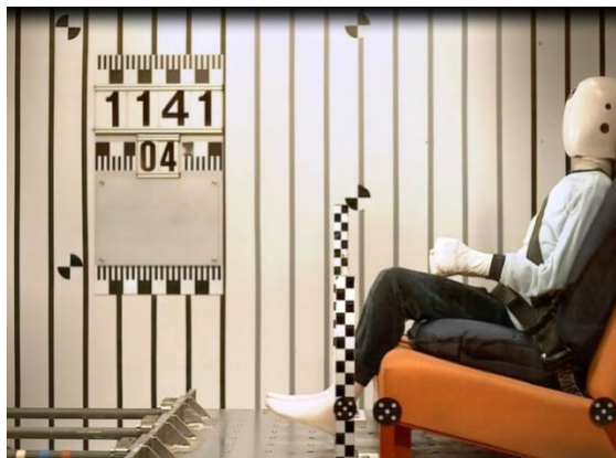
Рис 4а. Установка манекена.