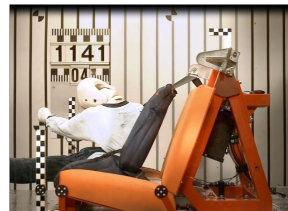
Рис 4с. Время 80 мсек. Начало подныривания. Нижняя часть ремня недопустимо проникает в область живота

Тест с фронтальным ударом в соответствии со стандартом R44/04. На кадрах хорошо видно недопустимое проникновение ремня в область живота во время удара.