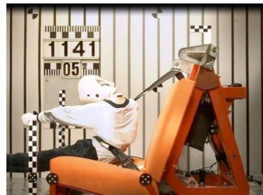
Рис 2в. Время 91 мсек. Началось подныривание, нижняя часть ремня недопустимо вошла в нижнюю часть живота.