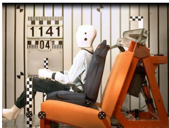
Рис 4б. Время 40мсек. Положение манекена и геометрия ремня во время фазы нагрузки.